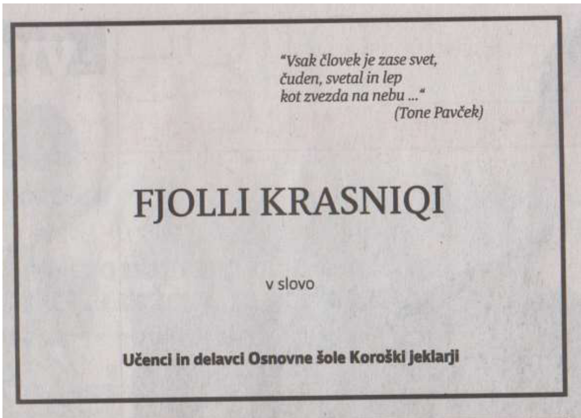
Večer, četrtek, 14. januarja 2016