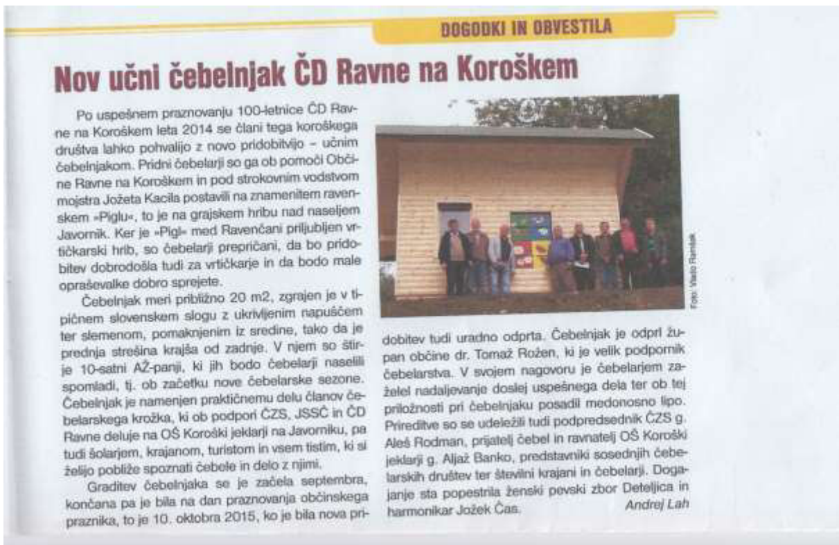
Slovenski čebelar, december 2015